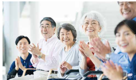
■独居高齢者世帯の推移(市内)

安心すこやか窓口、介護事業者、民生委員、ボランティア団体などと連携し、体制の強化を図って参ります。