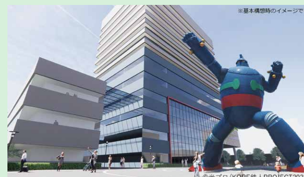
西市民病院 完成イメージパース