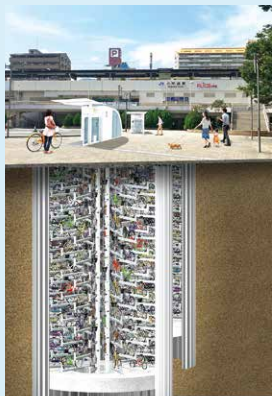
JR六甲道 駅前駐輪場完成イメージパース