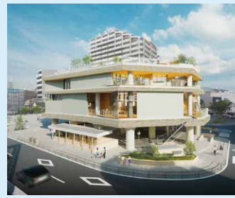
新垂水図書館完成イメージパース