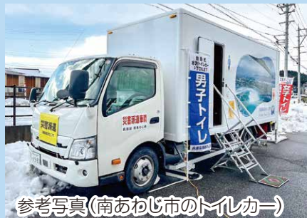
参考写真(南あわじ市のトイレカー)

東日本大震災や、能登半島地震でも活躍したトイレカー。神戸市でも導入を求めた結果、車椅子対応のトイレカーが1台導入されます。